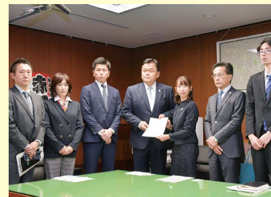
関東交通犯罪遺族の会(あいの会)から要望

2020年6月、道路交通法を改正しました。高齢ドライバーの事故を未然に防ぐため、75歳以上を対象に「運転技能検査」や「サポカー限定免許」を導入しました。