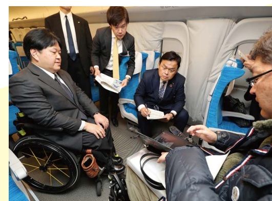
新幹線の車いすスペースの実証実験に参加

新幹線の車いすスペースを現在の1編成1～2席から6席に増やしました。インターネットによる利用予約・購入手続きも可能になり、利便性が向上します。