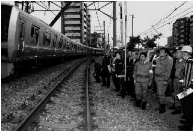
JR福知山線・列車転覆事故現場を視察する赤羽かずよし衆議院議員を始めとする公明党緊急対策本部視察団

4月25日に発生した尼崎市内でのJR西日本・列車転覆事故では、赤羽かずよし衆議院議員は、緊急対策本部副本部長として、国土交通省・JR西日本そして事故現場から情報収集を行うとともに万全なる対策を講じつつ、翌日、現場検証を実施した。