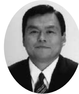
衆議院議員 赤羽かずよし

JR西日本福知山線の列車脱線転覆事故では多くの死傷者を出し、まずご関係の皆様方に心からお見舞い申し上げます。今回の事件を教訓に、党国土交通部長という与党政策責任者の一人として、北側国土交通大臣とともに二度とこのような事故を起こさないよう全力を尽くして参ります。また、地元では神戸電鉄に対し安全対策のためATSの設置を要請し実現をさせていただきます。