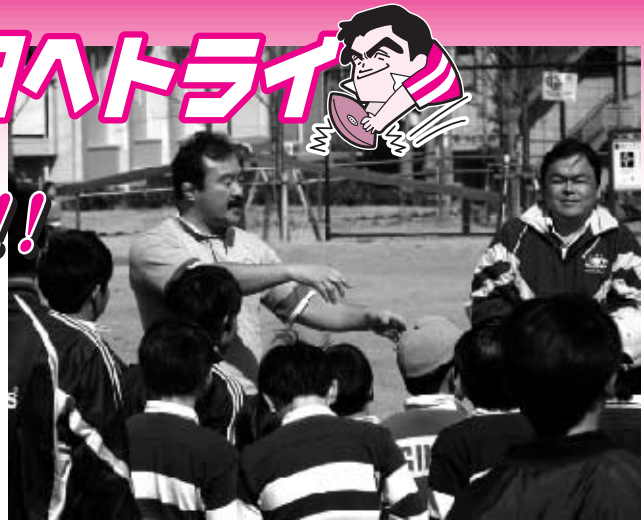
林敏之氏らと共にラグビーの実技指導をおこなう赤羽かずよし衆議院議員

ラグビーを通じて、勇氣・正義感・優しい心を学んだ赤羽かずよしは、昨今の青少年による痛ましい事件に頭を痛め、古くからの友人で全日本ラグビー元主将の林敏之氏(神戸製鋼)らと共に震災復興10周年事業「将来世代プロジェクト」として『ラグビー寺子屋』を立ち上げた。「何ものも恐れぬ勇氣」「限界に挑戦する強い気持ち」「仲間への信頼と自己責任」を少しでも伝えたいとの思いで、神戸北ラグビースクール、大開小ラグビースクール等の少年たちやご父兄と一緒に